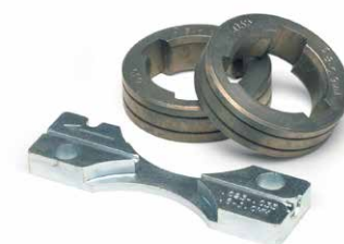
En imagen : KP1697-035C, Kit rodillos arrastre para hilos tubulares